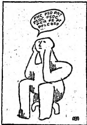
Desen de Ovidiu MARCU

P.S. 1. Mulțumim dl-ului Mitterand pentru frumosul cadou pe care ni l-a făcut de la Budapesta cu ocazia zilei de 24 Ianuarie. N-o să-l uităm. Și nu uităm că și în Franța se fac alegeri. Explicațiile ambasadorului Franței, ca și cele din Paris sînt cam stînjinite. Așteptăm reacția presei europene. 2. „Prietenii” din afară și din țară — adică tot din afară — au semănat panica în legătură cu așa-pretinsele detașamente de teroriști, care de ziua fostului dictator vor arunca țara în aer. S-au lipit așise, la unele cămine elevii au plecat în orașele și satele de baștină... Mulțumim „prietenii”, pentru grija pe care o manifestați față de liniștea noastră! N-o să vă uităm nici pe voi.