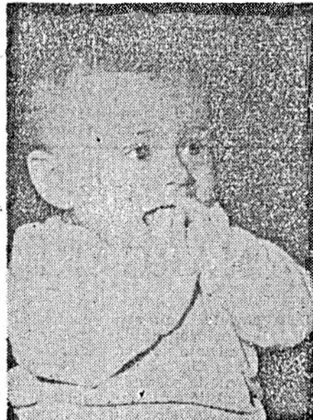
Pentru sănătatea copiilor — opriți poluarea

— Evident, nimic. Fiecare se descurcă pe cont propriu. Ceea ce e greu, e imposibil, cum te poți „apara de aer”? De aerul de care ai nevoie? Ideal ar fi ca fabricile care produc poluarea, în primul rînd de Celuloză chimică, de Sulfură de