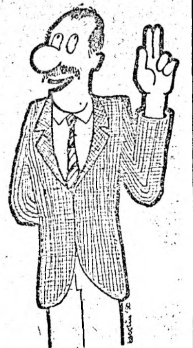
— Jur să spun ADEVĂRUL, tot ADEVĂRUL și numai ADEVĂRUL... Desen de Mihai BACOCIU