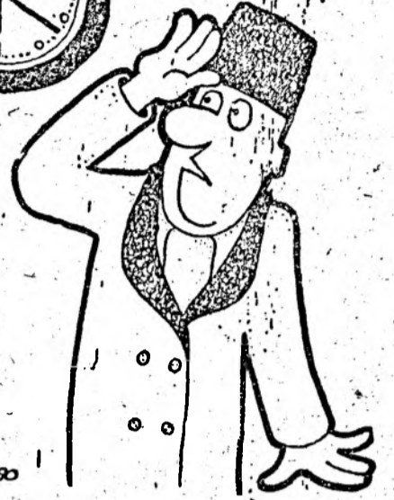
— Vai ce uituc sînt! Aveam la 11 o revoluție... Desen de Mihai BACOCIU

M.R. nu mai vorbim! Și atunci? Acolo unde lipsese măsuri și atitudini ferme din partea oficialităților se descurcă poporul cum poate. Nu întotdeauna ortodox. Dar spontan și sincer și îndreptățit. După dreptatea efectului inevitabil. Dacă ne vom crampona la nesfîrșit pe măruntirea efectelor și vom ignora cauzele tot ce-i mai rău e cu putință. Nu lăsam să scape nici cel mai mic prilej. Protestele, cererile de anchetă, proclamațiile au ajuns hilare prin micimea mizei — dar risul e galben. Intoleranți, bătaioși, căutători de noduri în papură, măcinăm în gol și a pagubă. Ba, dacă rentează, nu ne dăm în lături nici de la mici, dragălașe trădări.