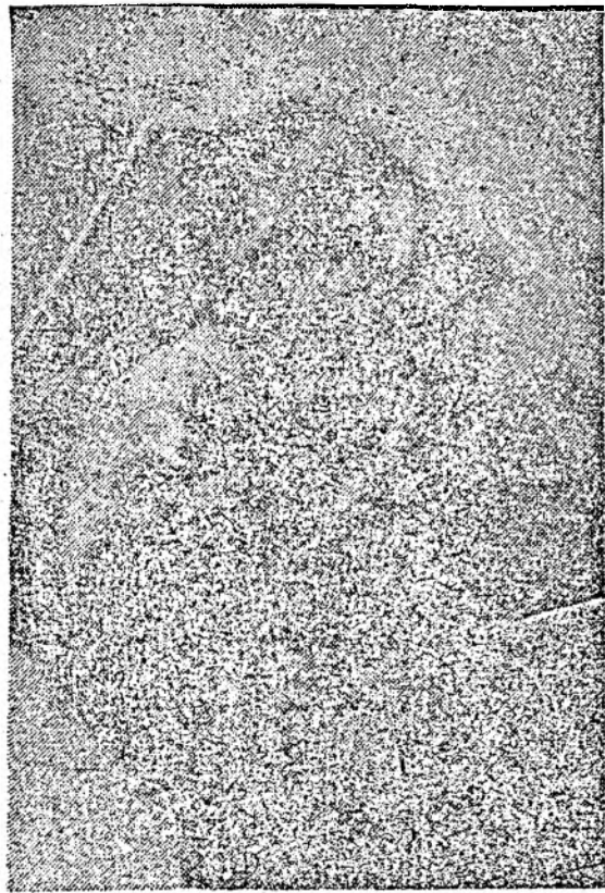
A ruginit frunza din vii și ciorchinii se „ruginesc” în... tuiuburei.

Deși s-au făcut sesizări la întreprinderea în cauză, nu am primit nici un răspuns. Luni de zile conturul de apă nu este cîștit, taxele fiind fixate după bunul plac al celor din bloc.