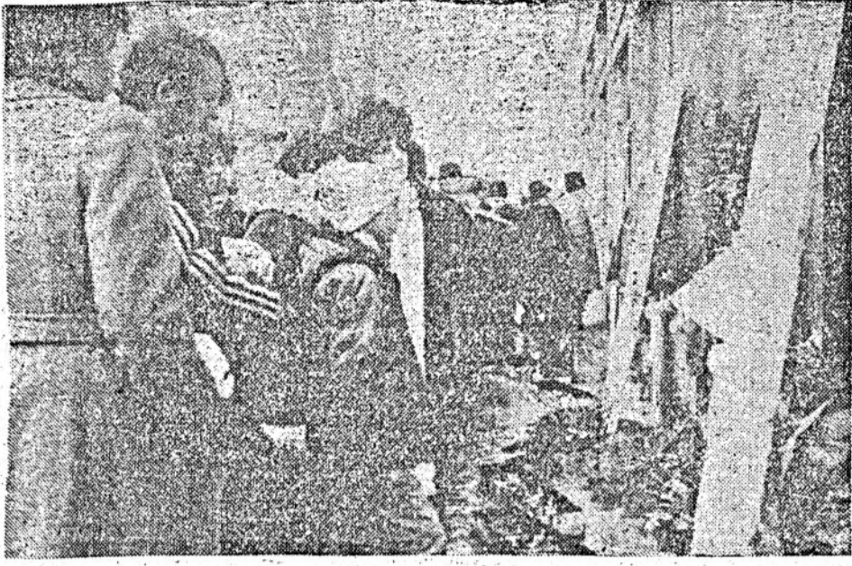
Să nu-i uităm niciodată pe cei care au trecut în eternitate cu pașaportul de eroi ai neamului românesc