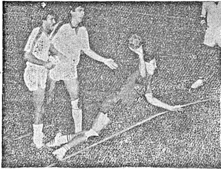
Fază din meciul „U” — Hidrotehnica

ETAPA A VII-A: Farul — Steaua, Rapid — Sportul Studențesc, Dinamo — Corvinul, F.C.M. Brașov — F.C. Bihor, Gloria — Progresul, „U” — Universitatea Craiova, „Poli” — F.C. Argeș, S.C. Bacău — F. C. Inter și Jiul — Petrolul.