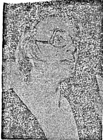
„Pentru clujeni, felicitările mele și toate cele bune”

Svetlana Toma, sinteti cunoscută publicului nostru prin rolul Rada din „Șatra”, film regizat de Emil Loteanu. Ca artistă, vă reprezintă Rada cel mai bine?