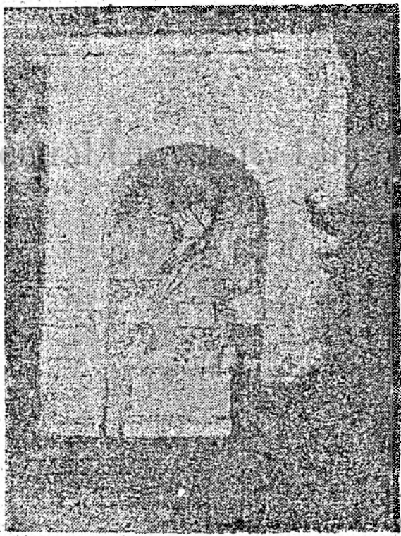
REPUBLICA ROMÂNIA, în Cluj

Sfîntu Gheorghe, 30 iulie 1990. Conducerea U.D.M.R., MADISZ, Partidul Micilor Gospodari și Partidul Romilor (Text preluat din ziarul „CUVIN-TUL NOU”, Covasna, 2 august 1990)