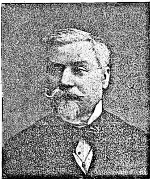
Berde Mózsás, 1848—49. kormánybiztos.