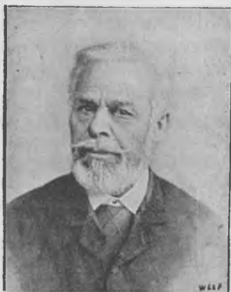
Ferenczy Ferencz, 1848-49. százados.