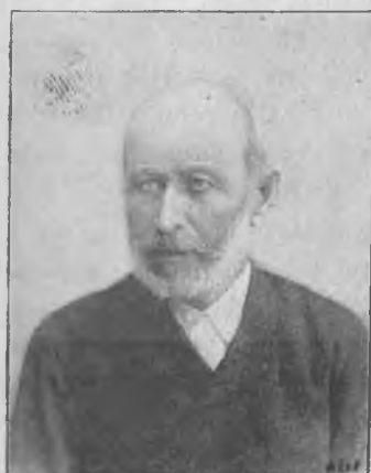
Münster Ede, közhonvéd.