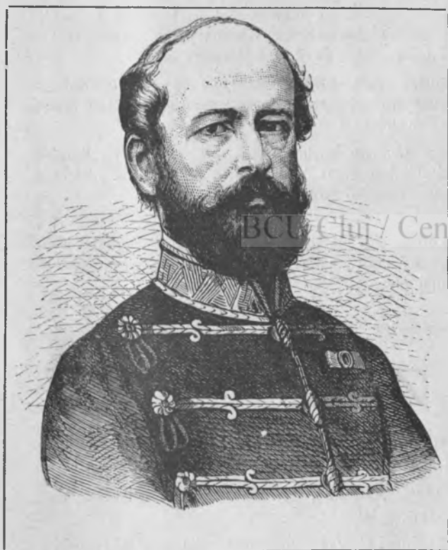
48-49. ezredes. „Hazánk s a Külföld“ 1868. évf. képe.