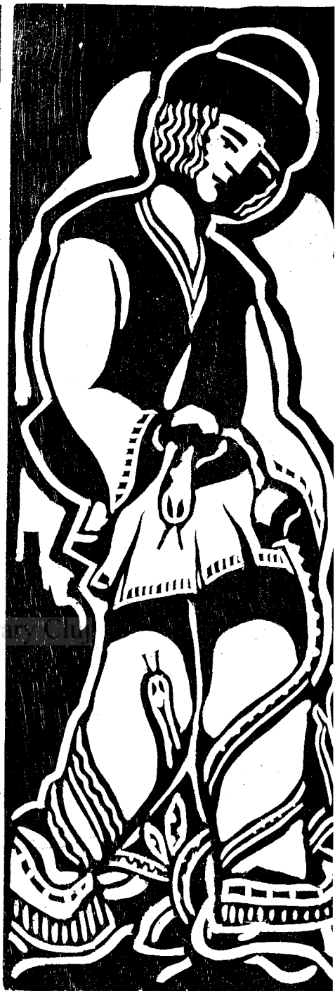
Cuib de năpărcă