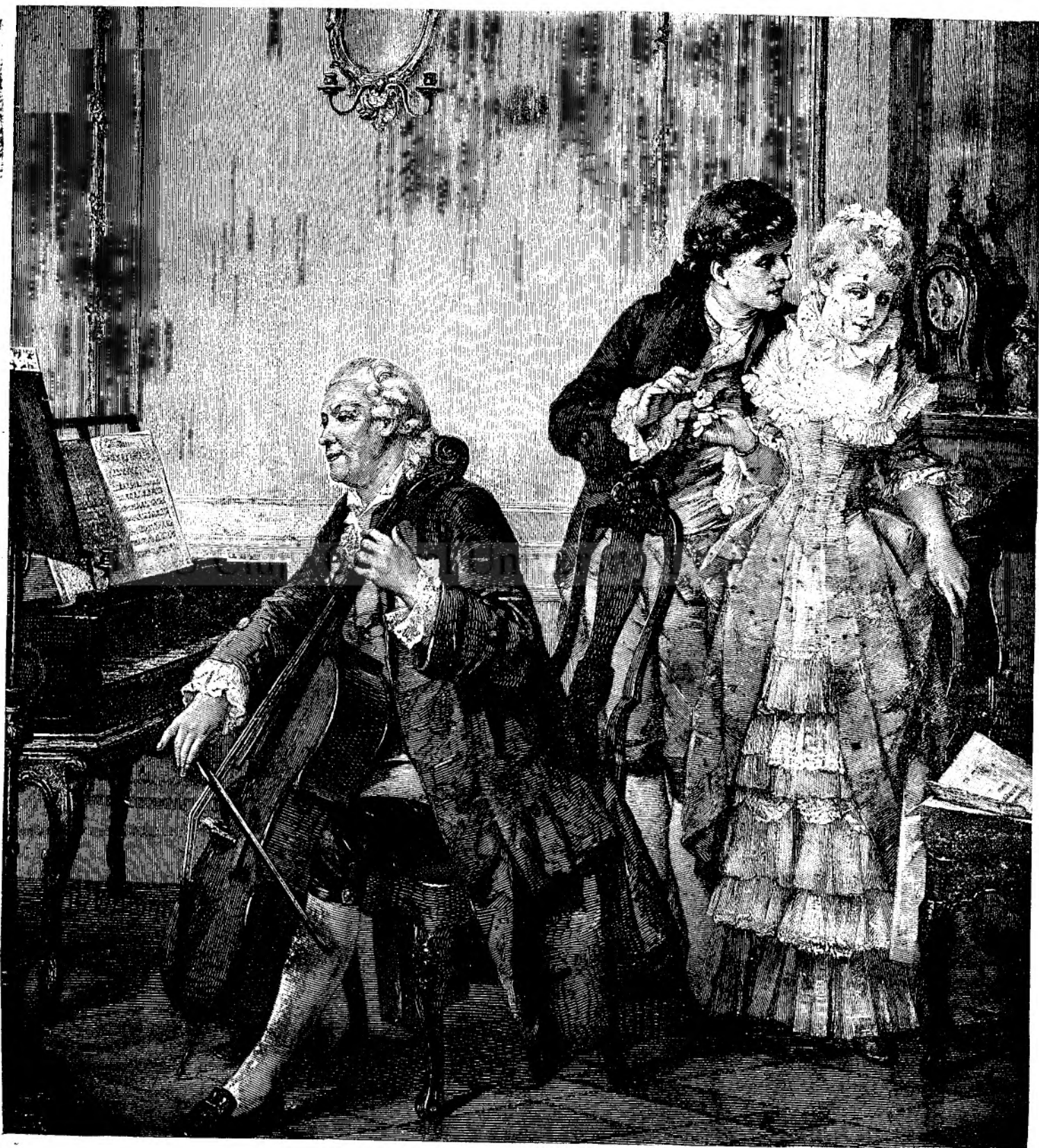
Lecție de muzică.