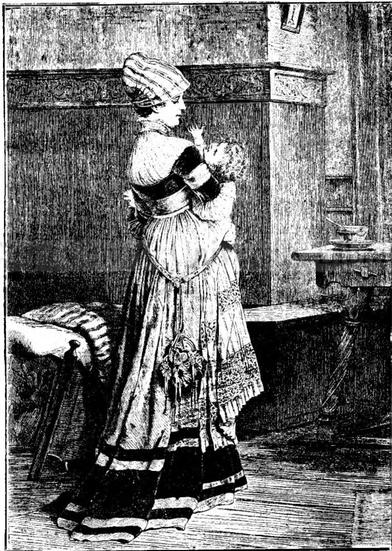
Bucuri de mamă.

Îl iaș pe al doilea și găsesc în cap: pâne. Apoi cărbuni și mai încolo defilarea micilor cheltueli zilnice reîncepe! La fiecare zi întei e notă mai gravă: șapte ruble — chiria.