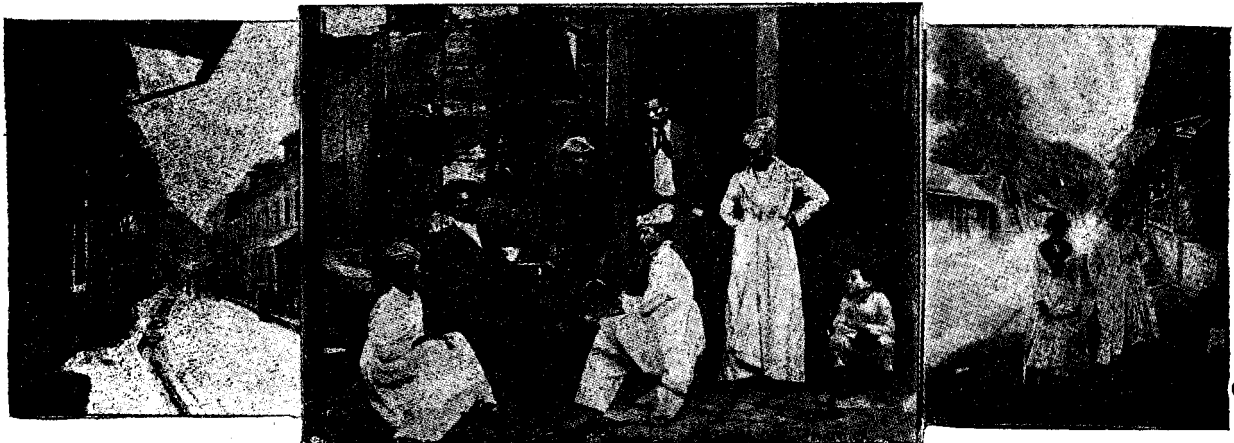
Strada principală în St.-Pierre.