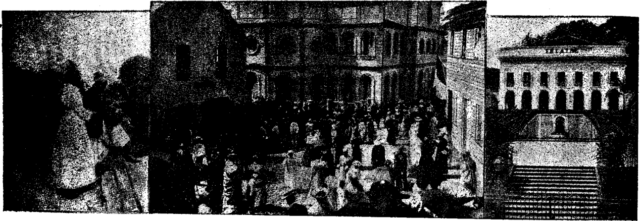
Negustor de zahăr. Piața principală în St.-Pierre pe timpul missei mari. Teatrul din St.-Pierre.