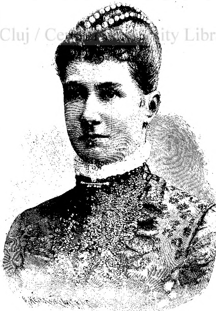
AUGUSTA VICTORIA, IMPERĂTEASA GERMANIEI.

Doamne cât s'a mai schimbat și omul acesta. Statura lui naltă i dă o înfașurare și mai slabă. Pe obrajii lui, pe cari odinioară inflo-riau crinii, se vîd urmele suferințelor sufletești. Buzele lui sînt vînete și scîdute. Ochiul lui mici adînciți în ceasta capului. Mă-nile lui din slăbite și subțiri ce erau, au devenit ca fusul și poți număra toate oasele în ele. Picioarele tot asemenea. Doamne sfînte, să nu fie în uniformă cea frumoasă, te-ai speria și ai fugi de el. Ai gîndi că e moartea în picioare, atât de slab e. Singure mustețile au re-mas aceleași, mici, negre, ca mura cea mai neagră. Ele numai impodocesc obrazul cel rumen de-odinioară — și altă nimic. Glasul lui odinioară ager, a devenit slab, răgușit. Aceasta schimbare se arată în toate ale lui. Cu compania ese foarte