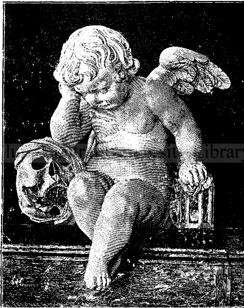
Toate sînt trecătoare.