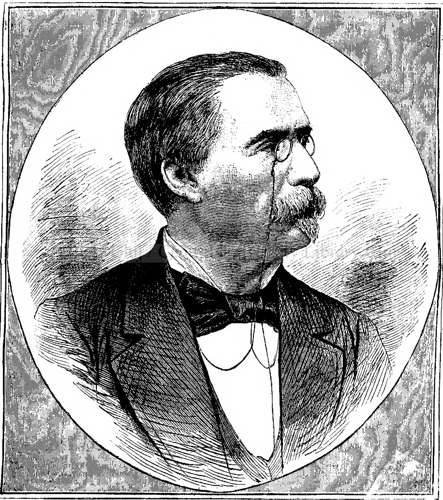
CANOVAS DEL CASTILLO Prim-ministrul ucis al Spaniei.