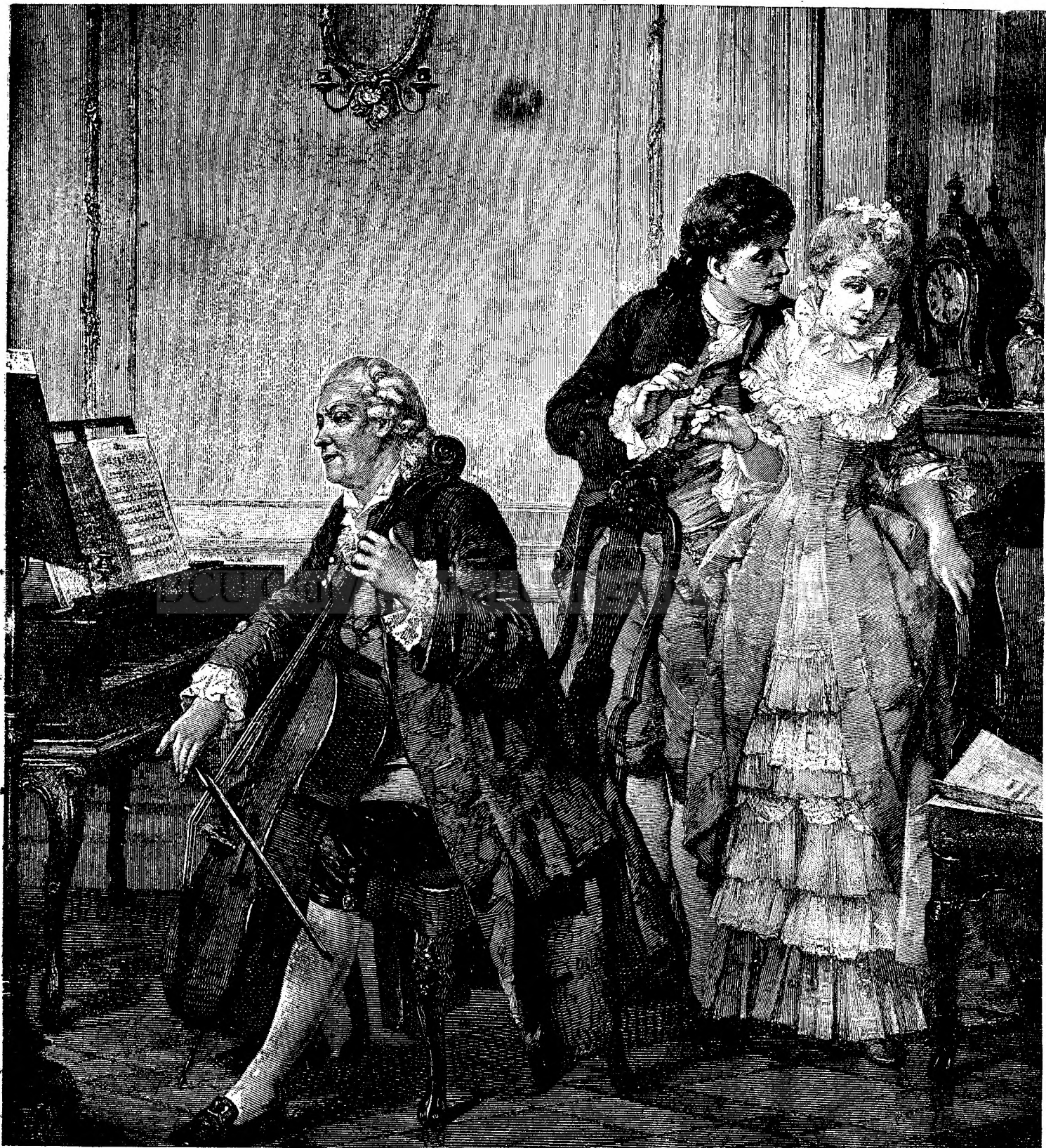
Vis și realitate.