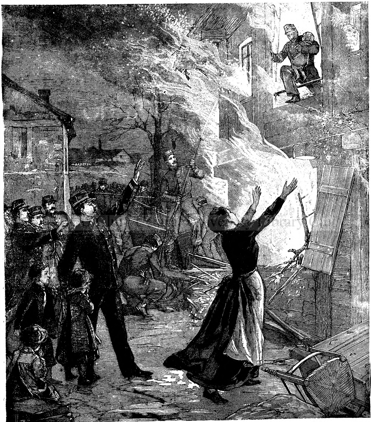
M a n t u i t o r u l .