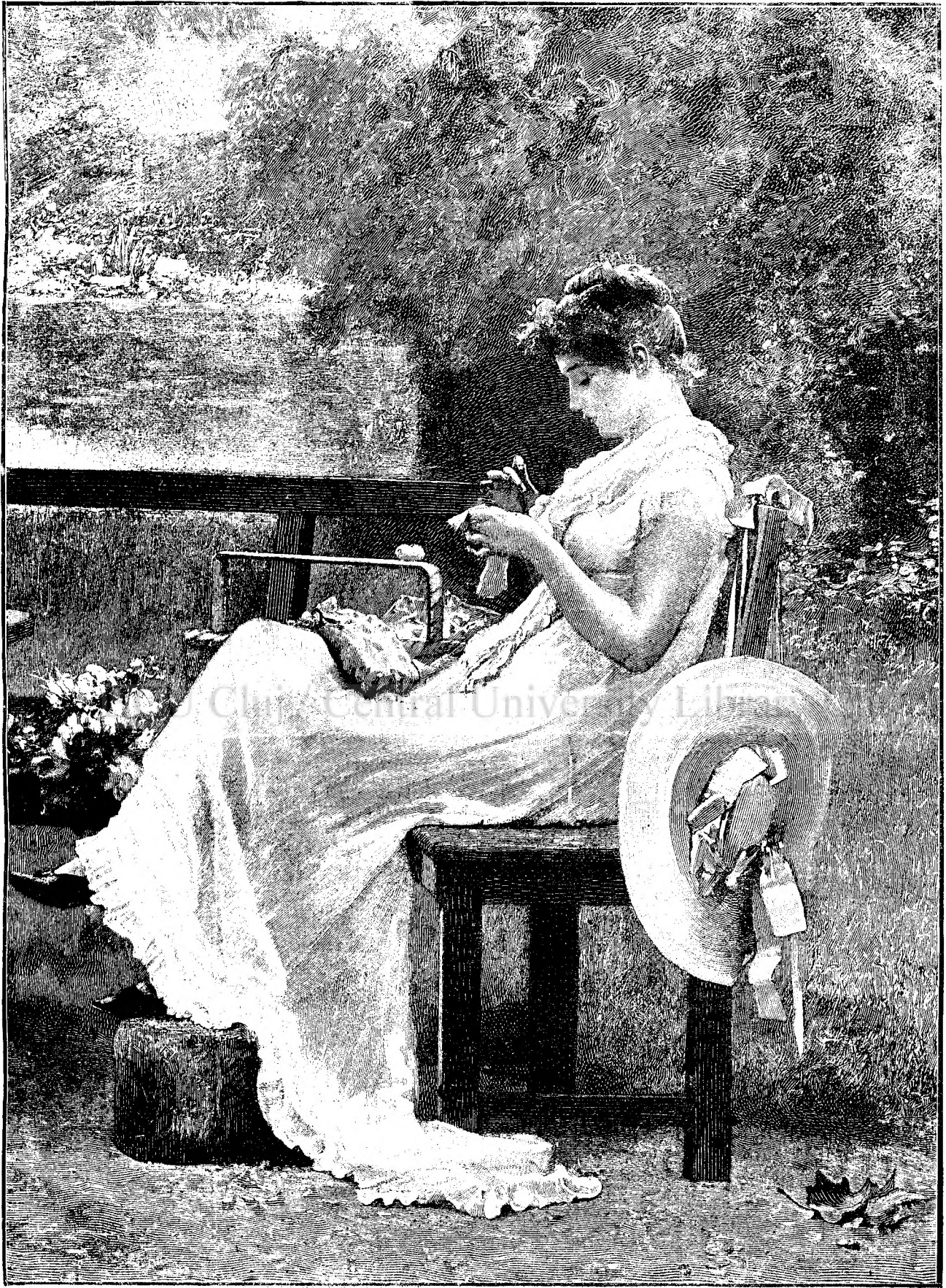
L A S O A R E.