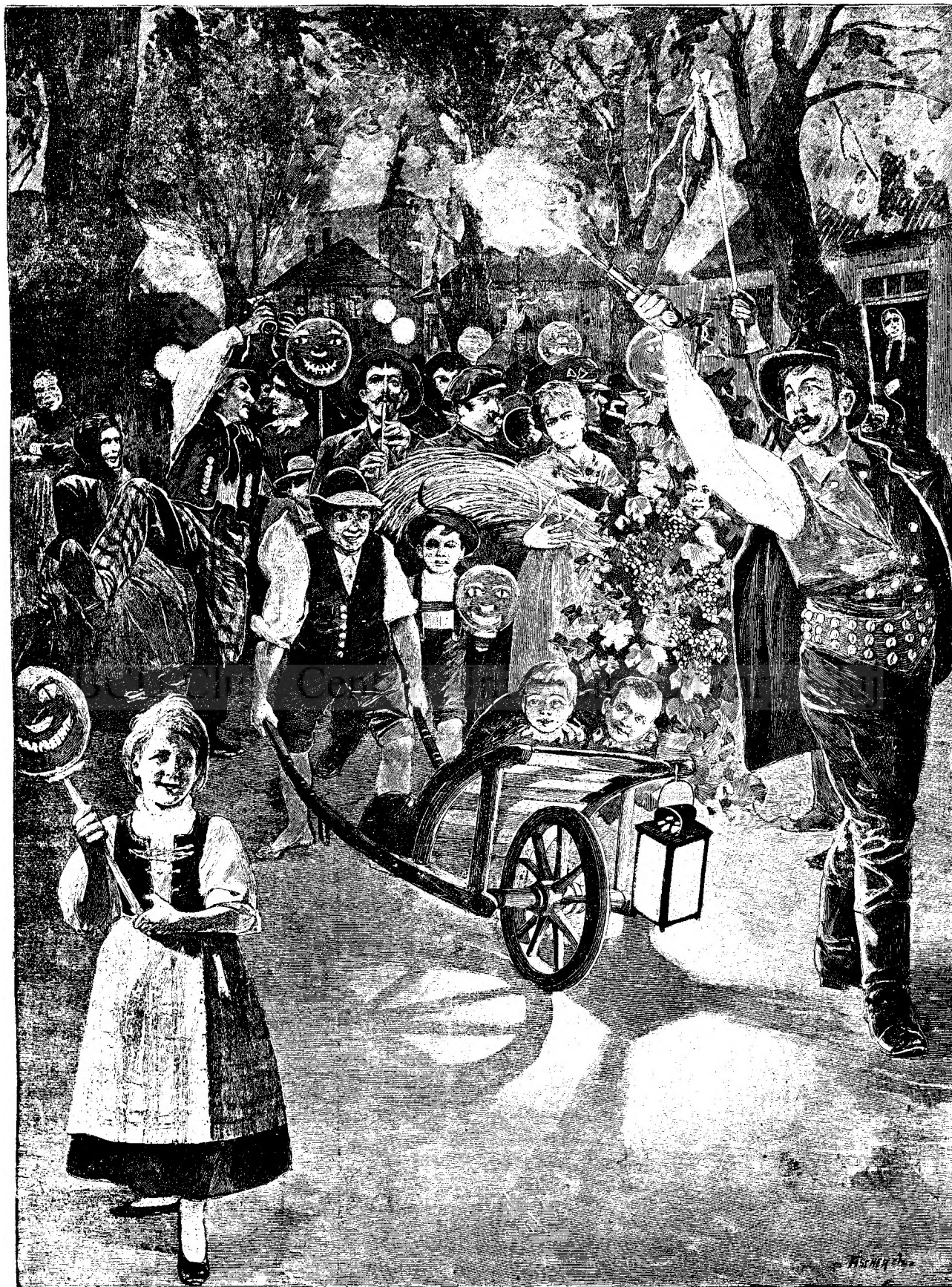
SERBAREA COPILOR ÎN AMERICA.