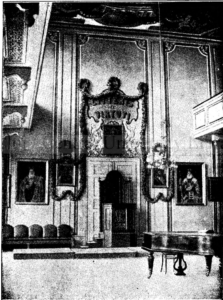
Frontul sălii festive a gimnasiului.

Şi dacă-mi întetesc privirea căutând a străbate prin vremuri până la acel timp clasic de muncă desinteresată, insufleţirea ideală şi frăţească unire, — din umbra vremilor trecute îmi resare înaintea ochilor