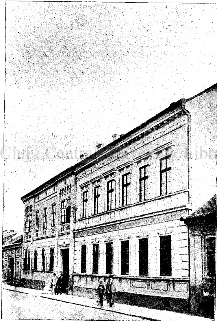
Școala elementară normală gr. cat. din Oradea-mare.