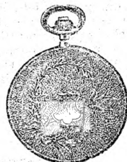
Nr. 2. Orologiu anker-remon. de argint, 50 mm. diametru, cu capac dublu, toc guiloșat ori gravat, 3 capace de argint, 5 rubine, sorte tari, I. fină „Uraniawerk“ 15 rubine, fl. 12.50.