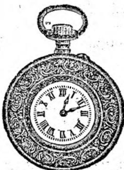
Nr. 3. Orologiu cilindru-rem. de argint, 48 mm. diametru, cu placă de cifre în email albă ori colorată cu toartă ovală, arătător de secunde, construcție bună so- lidă, fl. 8.75.