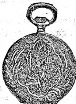
Nr. 5. Orologiu anker-remon. de argint, 50 mm. diametru, capac dublu, 3 capace de argint, 15 ru- bine, cu cerc de aur, fabricat fin, din sorte mai tari fl. 11.50, cu construcție cil.-rem. fl. 9.50.