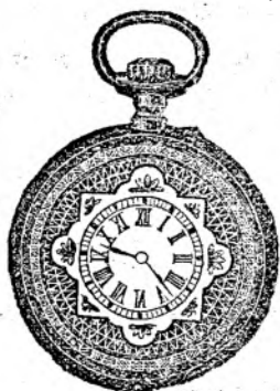
Nr. 1. Orologiu de argint remon- toir, pentru dame; 30 mm. diametru, cu capac de argint, cualitate bună fl. 6.75, cu cerc de aur fl. 7.50, de oțel negru oxidat fl. 6.50.

Reparaturi de tot soiul se eșecută bine și conștientios.