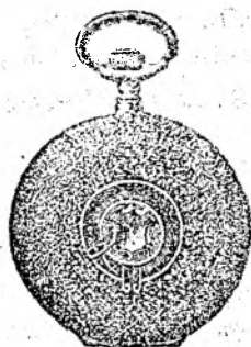
Nr. 4. Orologiu cil.-rem. de ar- gint, 48 mm. diametru, cu capac dublu, în toc gravat frumos, sorte tari, I. fabricat fin fl. 8.75.