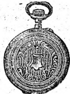
Nr. 7. Orologiu cilindru-remt. de argint nou, 48 mm. dia- metru, luciu ori gravat, în formă ovală, arătător de secunde, cu placă de cifre albă, emailată, I. calitate, fl. 4.50, cu capac dublu fl. 5.80. Lanțuri de nk- kel cu compas ori cheia 30, 40, 50, 60 cr.

Prospecte bogat ilustrate gratis și franco. Spedări cu rambursă ori pe lângă trimiterea înainte a prețului.