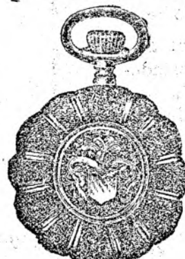
Nr. 6. Orologiu de dame, rem., de aur de 14 carate, 30 mm. dia- metru, capac dublu, I. calitate, guiloșat ori gravat fl. 25.—, în toc de argint fl. 11.50.