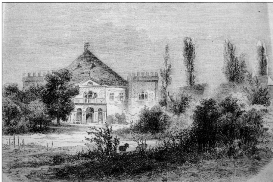
BCU Cluj / Central University Library Cluj

traducere literală, Sântioana de Fier. Satul a fost, cum s-a văzut, prilej de dispută în secolul al XIV-lea între două ramuri ale familiei Vos.