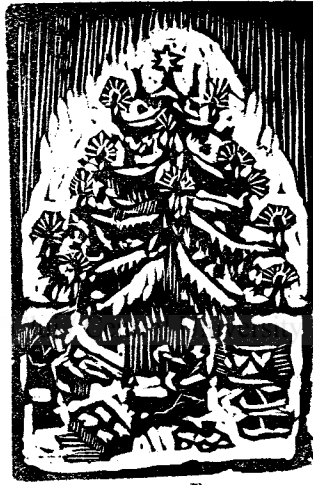
TIP „ARDEALUL“ CLUJ