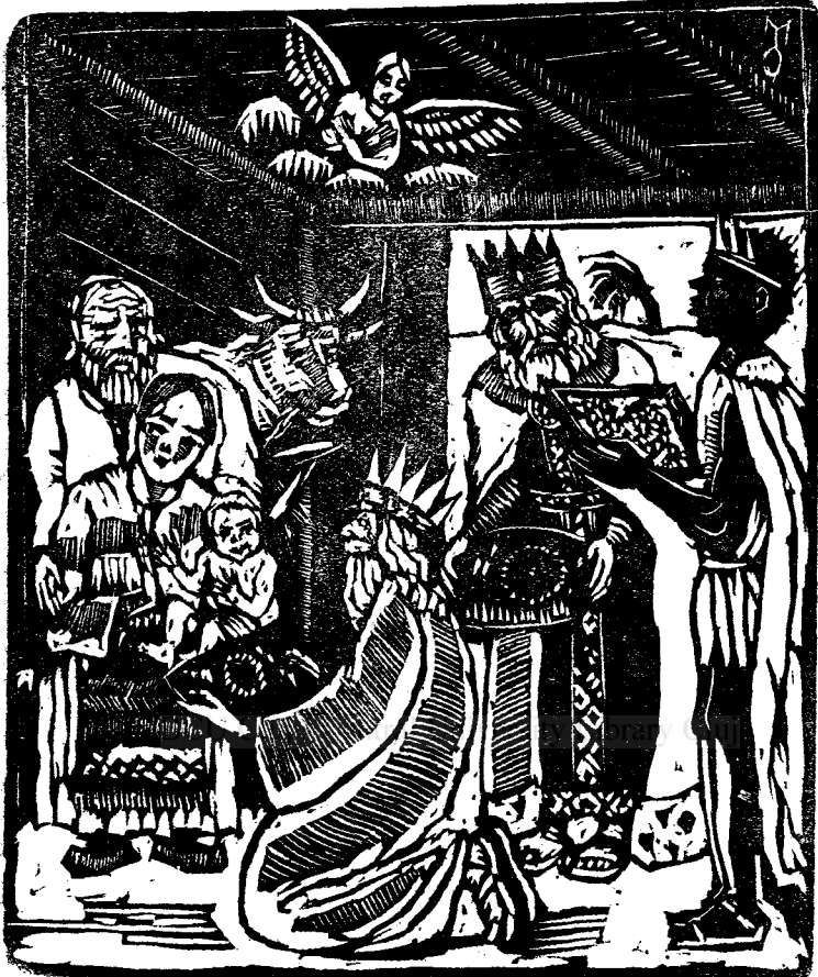
INCHINAREA MAGILOR, GRAVURĂ ÎN LEMN DE MARCEL OLINESCU