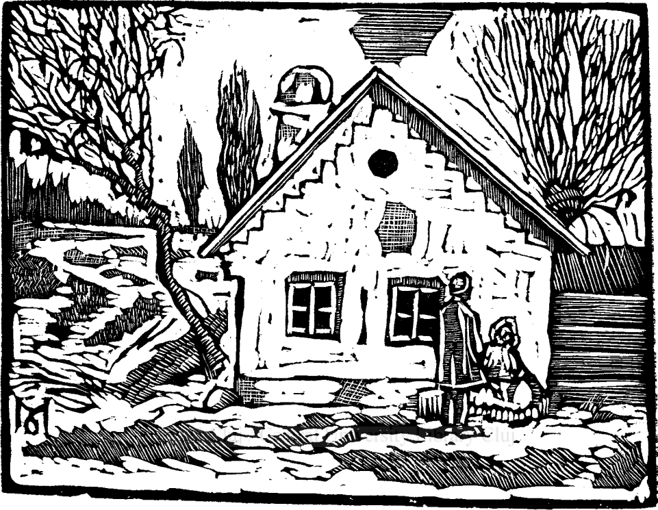
Peisaj, gravură în lemn de Marcel OLINESCU