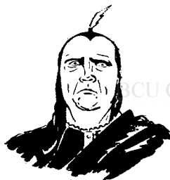
DL C. UJEICO