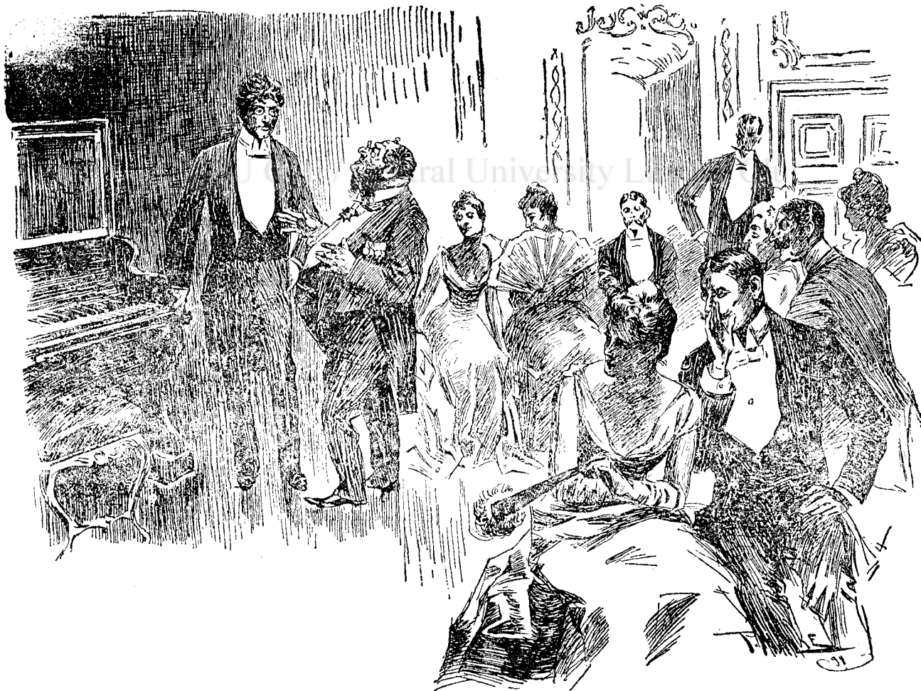
Petrecere de casă.