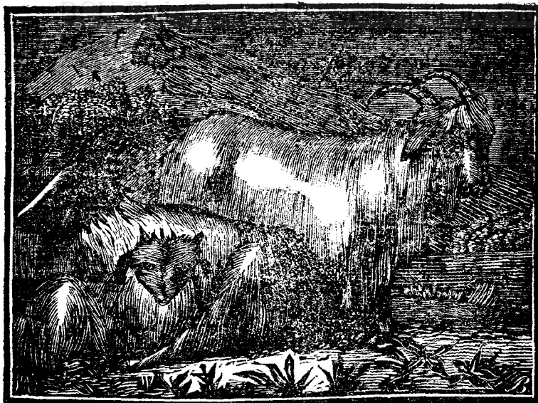
Феннекъ, Адааъ, шї Поркъ Еаіопіческ.

тілопї есте ꙗ мїжлок, Поркъа Еаіопіческ деа стѣнга, шї деа дрѣпта Феннекъа. Съ грѣім дїнтѣіѡ деспре ачест Феннекъ, деспре каре Фзптръкъ мѣате фѣаіѡрї де сокоатеаї саѡ фзкът, ба акъ ѡнї зїчѣ, къ нѡ съ афъз нїч ка кѡм. Іар акѡм съ