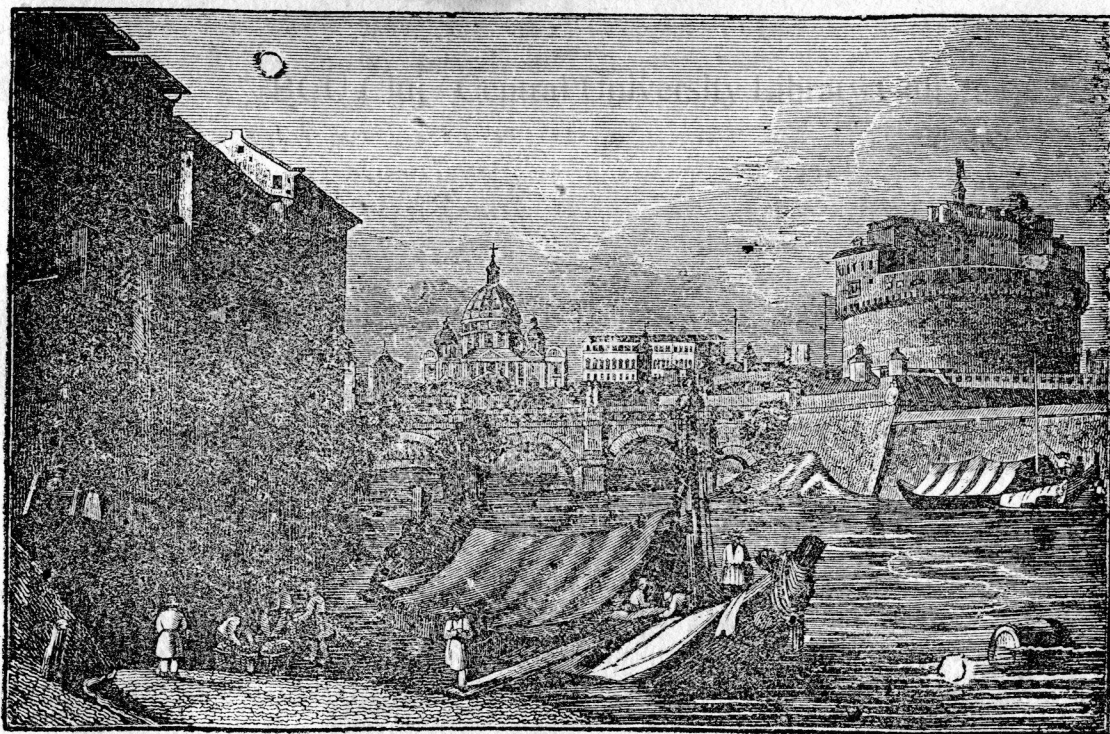
ЧЕТЪЦЪА АЦЕРЪАДІ ДЕЛА РОМА.

ЧЕТЪЦЪА АЦЕРЪАДІ ДЕЛА РОМА. МАХААЛОА (Czitalle) А ЧЕТЪЦІІ ЧЕІ ДЕ ВЪПЪТЕНІЕ А СТАТЪАДІ БІСЕРІЧЕСК, О ЗІДІРЕ ВЪКЪЕ, РЪТЪНАЪ, ШІ ТАРЕ АНЪМЕ ЧЕТЕЦЪА АЦЕРЪАДІ (Castello di St. Angello) СІТЕ ЗІДІТЪ ДЕ АНЪРАТЪА АДРИАН ЛА МОРМАН- ТЪА СЪЪ, ШІ ПЕНТРЪ АЧЪА СЪ НЪМЪЩЕ