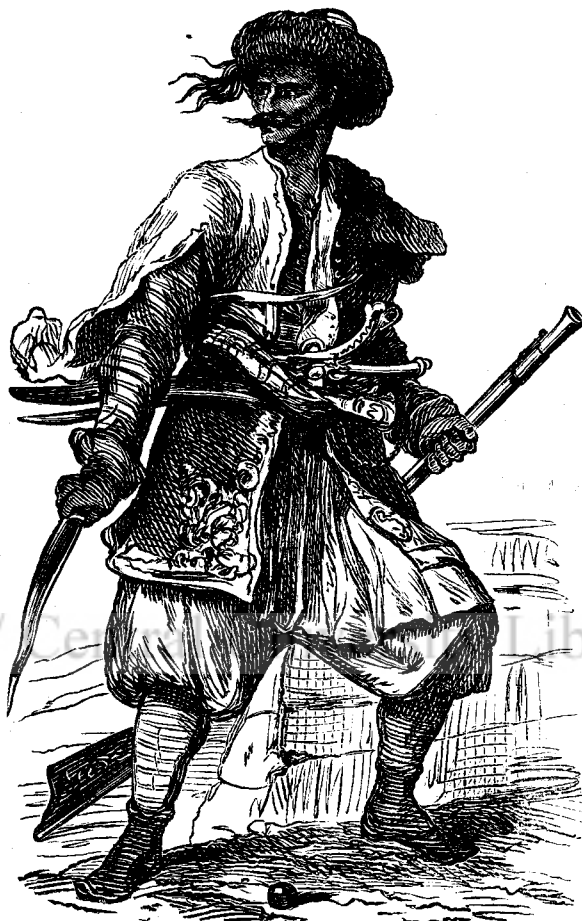
Bași - bozuc. (La pag. 23).

Rușii mai luară cu densii în război două batalioane de infanterie din reg. II și III, precum și 100 de dorobanți din escadronul dela Mehedinți. Unii din acești oameni cooperară cu Rușii în luptele dela Calafat, alții în cele dela Salcia și Cujmir.