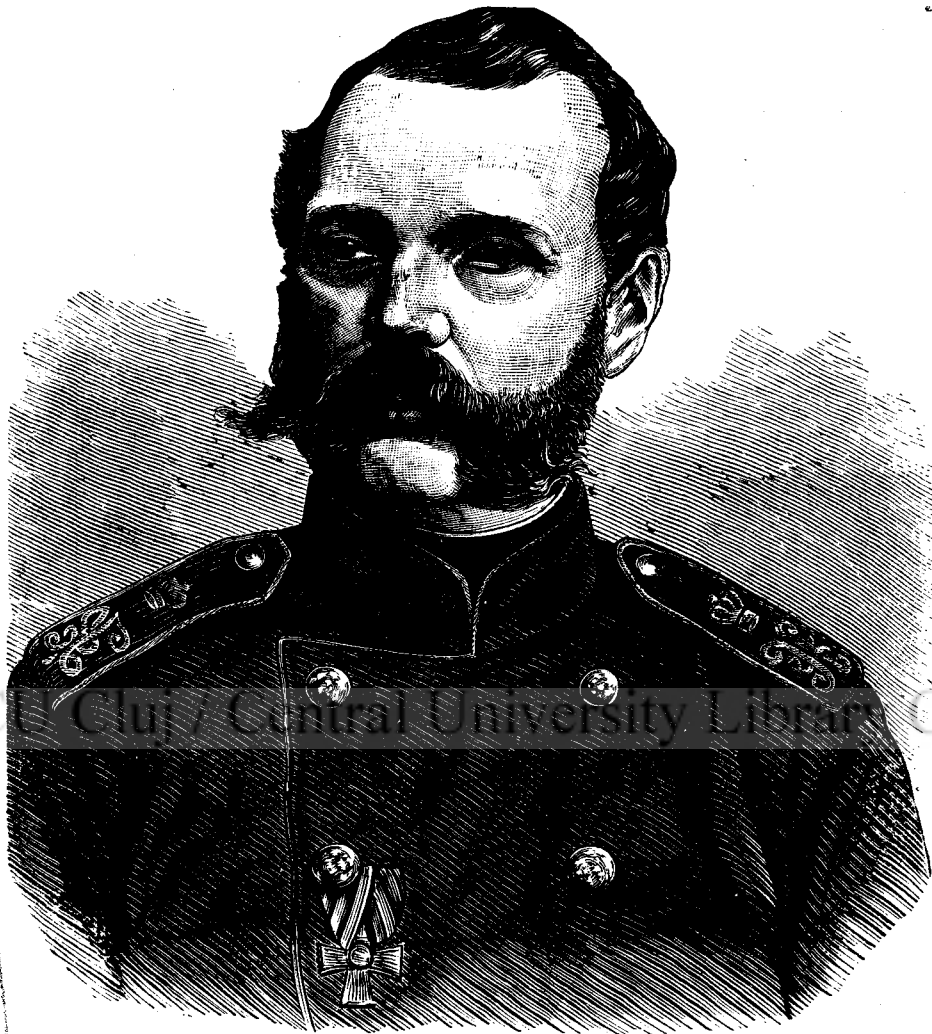
Alexandru II. (La pag. 15).

Așa dară cauzele de nemulțămire esistaū în tōte părțile, la musulmani, ca și la creștini; dară aceste cauze de nemulțămire erau tot-deodată și motive de revolte, de insurrecțiuni. „Dela sultanul Selim încōce — dīce un scriitor