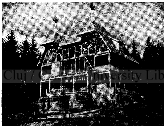
Uz Bence menedékház.

A madarasi Hargita-csúcs (1801 méter), oldala az ország egyik legalkalmasabb síelési területe. Novembertől májusig állandó sielésre