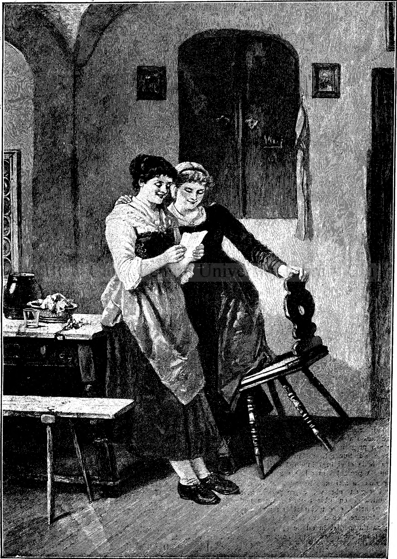
V E S T E B U N Ă.