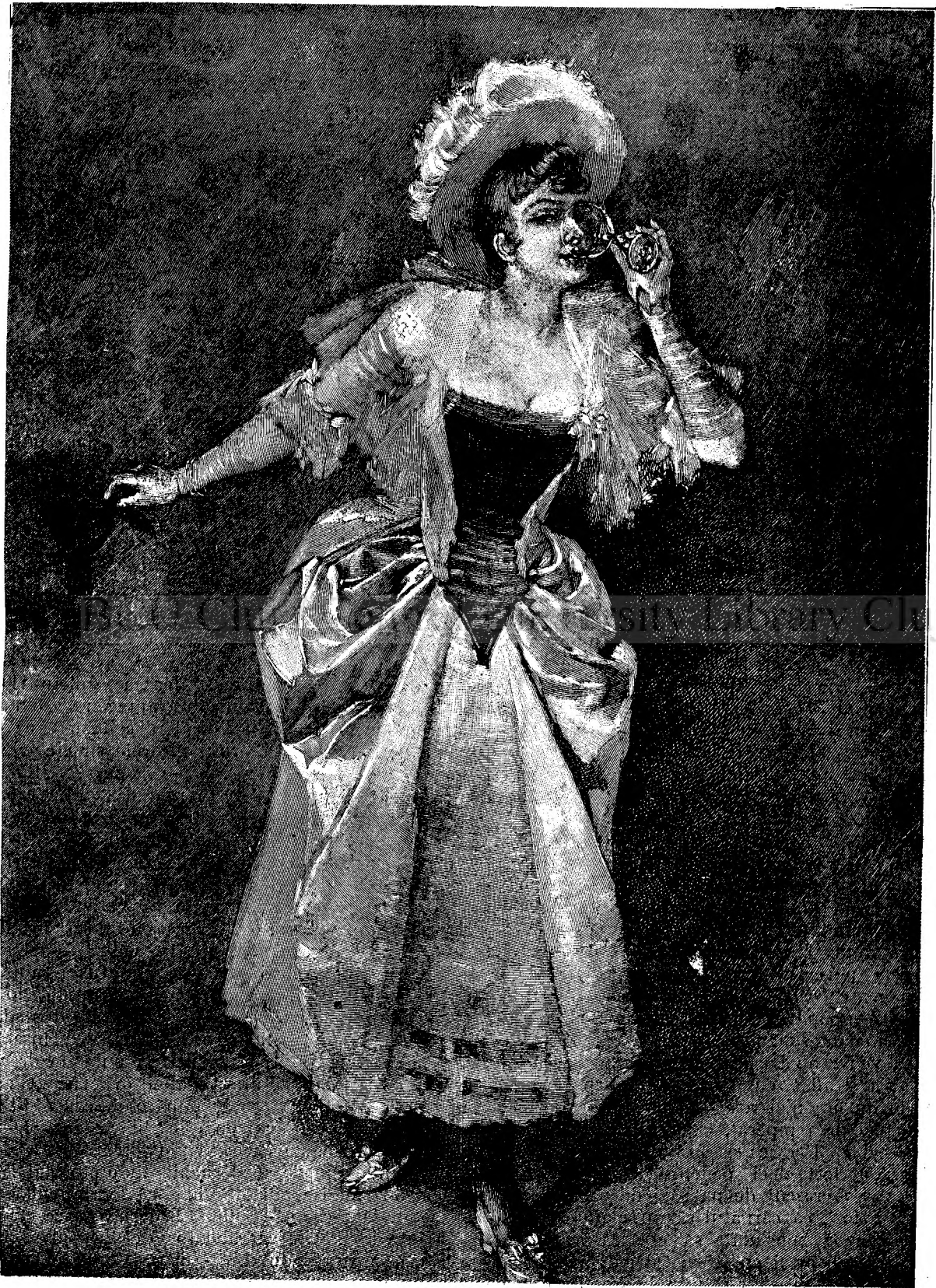
UN PAHAR DE ŞAMPANIE.