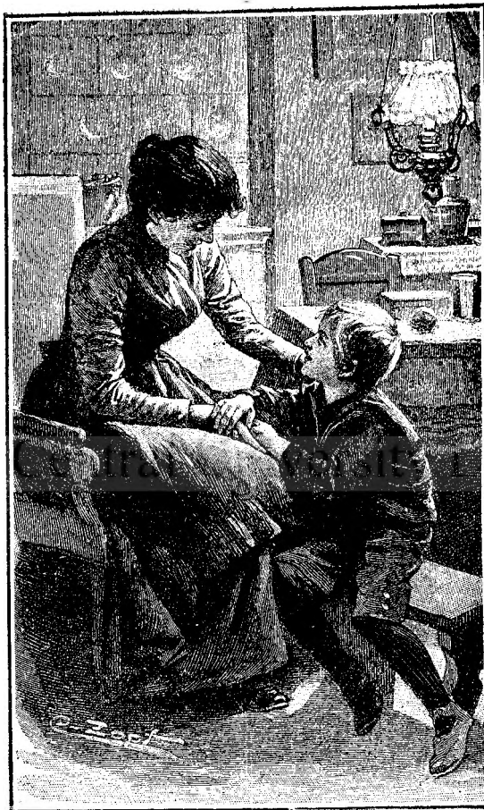
Frate și soră.