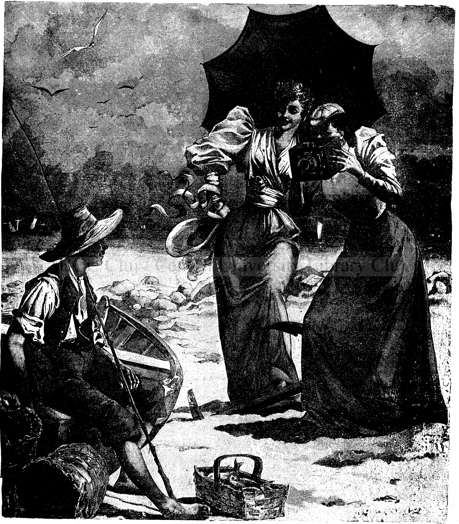
FOTOGRAFIARE LA MINUTA.