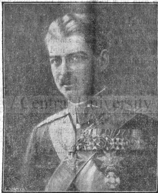
Maiestatea Sa Regele Carol al II-lea

această stâncă vrea să-și clădească toată truda și toată munca ce-l așteaptă. Multă de sigur și grea. Dar însăși greutatea ei va fi o plăcere pentru acela care poate spune, senin și împăcat în fața Domnului: „N-am alt gând și alt dor, decât să mă consum întreg, ca o candle, pe altarul Bisericii și al neamului meu”.