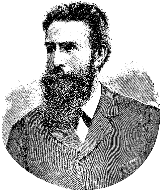
C. W. RÖNTGEN.

Și să ne aducem aminte că nu eră de loc ușor lu-cru într'o vreme „a face trei ȗile la domni“; cu tôte acestea amantul cre-dincios, iubitor și plin de