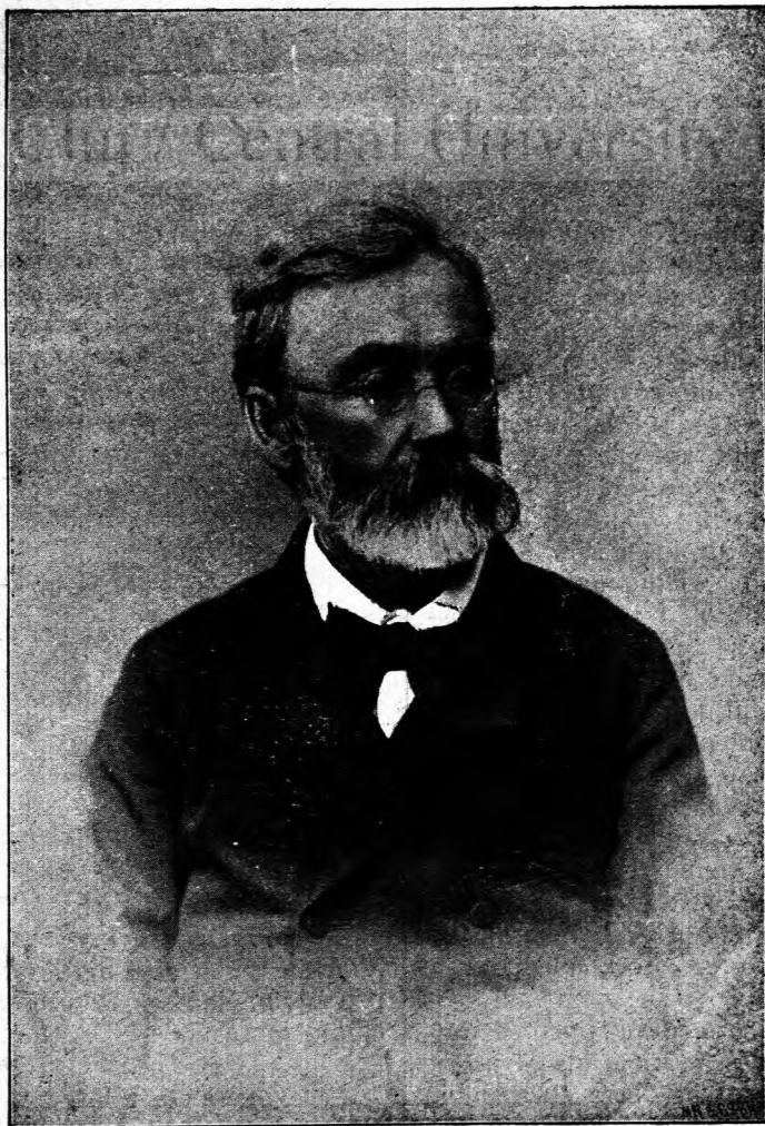
V. A. URECHIĂ.

Activitatea sa literară se imparte in științifică și literară. In știință cultivă istoria, cu graiul ca profesor la universitatea din București, cu condeiul ca autor al multor publicațiuni. A scormonit ani indelungi prin archivele mănăstirilor din țēră și prin altele din