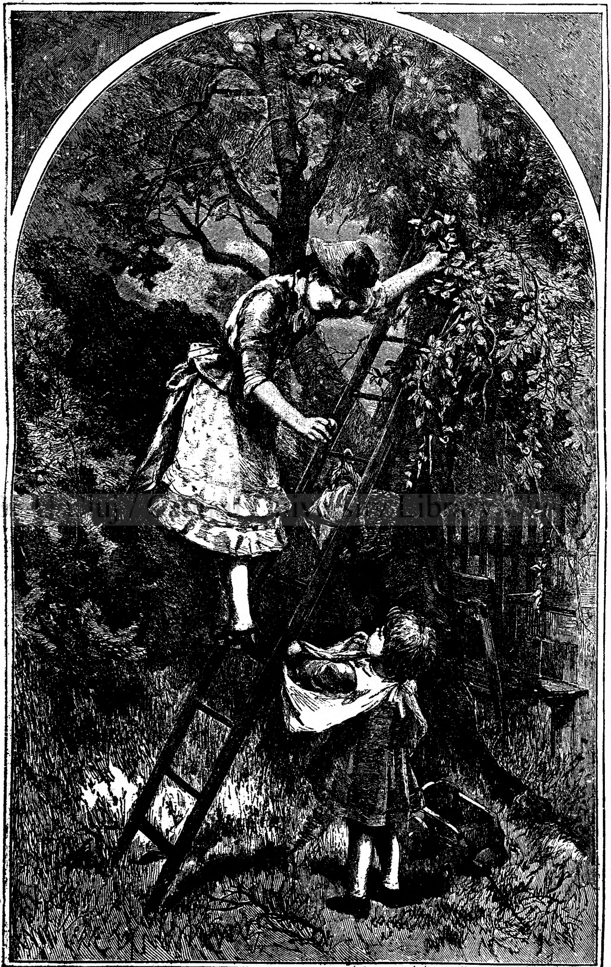
Т о м н а .