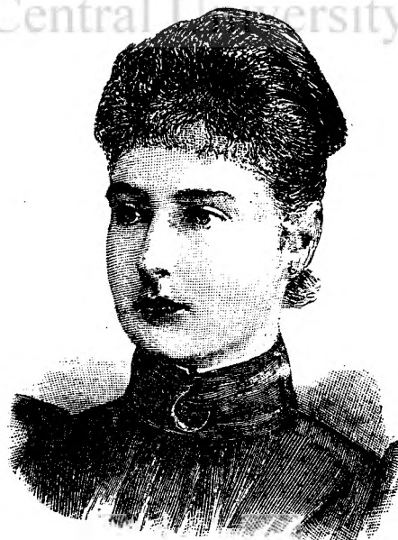
PRINCESA ALIX DE HESSA logodnica moștenitorului Rusiei.

Esemplul Sarei Bernhardt este și mai viu. La Paris, fie în Froufrou, fie în Tosca, în Fedra ori în Adrienne Lecouvreur, ea nu și-ar fi permis să jöce în modul exuberant, excesiv, apröpe epilectic, în care a jucat la noi și jöcă aiurea, căci acolo se teme de controlul criticeii și de susceptibilitatea gustului public, pe când aici, fără frëul unui termen de comparațiune, fără simțemântul unei rivalități și lipsită de respectul ce are pentru spectatorii parisiiani, a jucat cum a vrut și cum a fost dispusă, neavënd grijă că florile, aplausele și laudele gazetarilor ad hoc îi vor lipsi cumva! A trebuit să fie Coquelin, care să pörte în lumea întregă verva, veselia, gustul perfect și emoțiunea Comediei, fără să șovăiescă o singură dată, fără să sa-