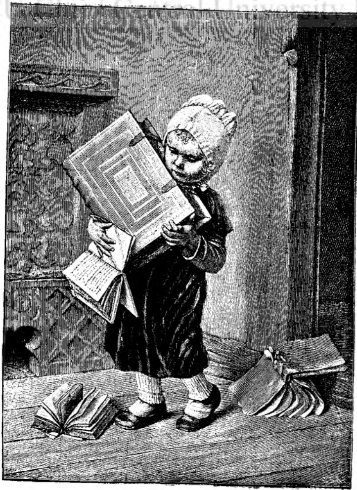
FATA CU CARTE.

mân, nu mai putură fi înădușite și-i slugiră de pirghie deschisă pentru a-ș lumină mintea și a se civilisá, de far conducător in cotro să-și strămute mersul. Când limba română deveni organul firesc de rostire al gândirilor, aceste idei furé cele dintei ce pëtrunsesse prin ea. Când in Ardeal o atingere mai de aprópe cu cultura apusenă impinse mintea Românilor spre dobândirea de lumini, cele dintei ce se aprinseră in ea furé tot acele idei mântuitoare. De aceea și de acolo inainte, cu cât se implântă mai adânc cultura apusenă in sufletul națiunii române, cu atâta se întăriau mai mult atare cugetări. Născute întei pe tărîmul istoric, in ambele rënduri când ele apărură, se intind și cuprind tot orizontul intelectual, impingându-l a le da ființă in tóte formele sale de manifestare, in lirică pe cât și in satiră, in epopée cât și in novelă și chiar tóte celelalte strădanii spre cultură și însușirea ideilor civilisate are in ultima analiză de țintă tot întărirea naționalității și desvoltarea limbei ca organul ei cel mai de sémă. Ceea ce predominesce in intréga cultură a poporului român este nota patriotică, și eră firesc lucru ca desvoltarea lui să apuce pe atare cale, intru cât el trebuia inainte de tóte să-și afirme esistența, tãgăduită ca o fire a parte de dușmanii ce-i incunjiură; iar afirmarea esistenței nu se putea face fără o resfrângere vecinică asupra ei a tuturor manifestărilor culturale.