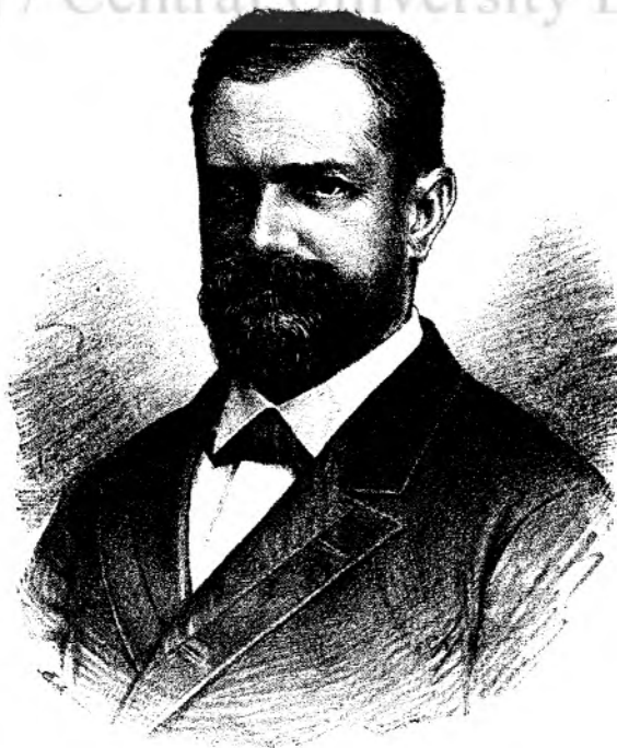
GR. G. TOCILESCU.

Pecat că ia parte atât de activă la mișcarea politică, căci acēsta îl reține mult dela adevărata sa vo-