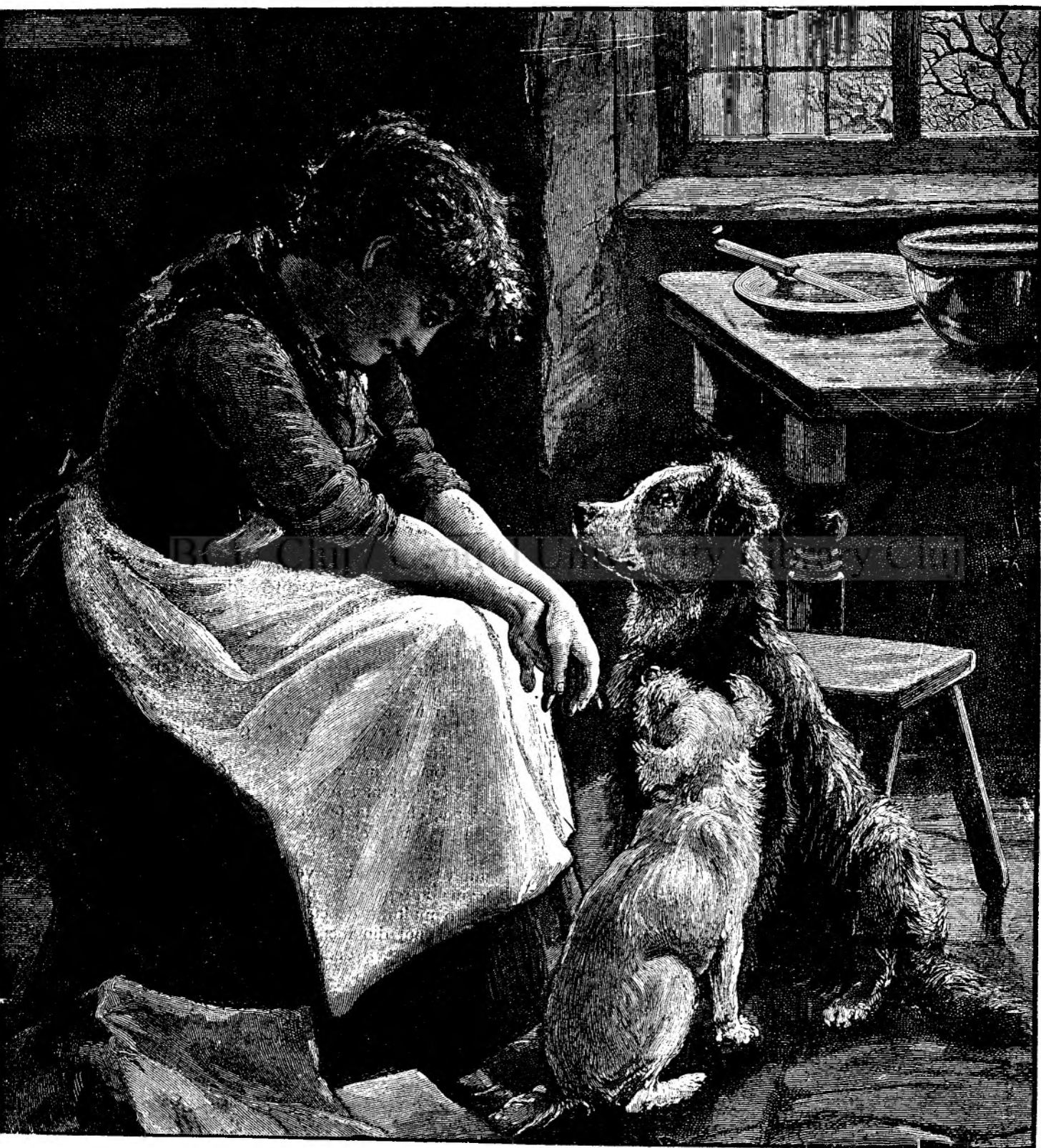
Pă r ă s i t ă .