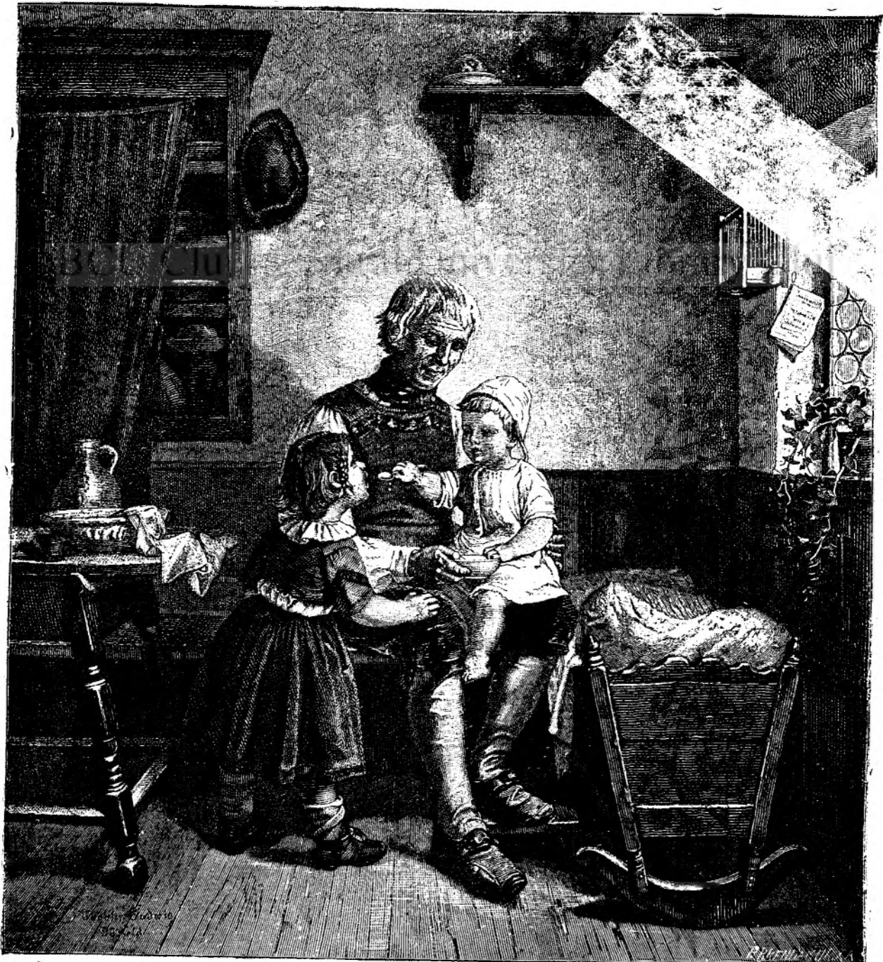
Moșul și nepoții sei.