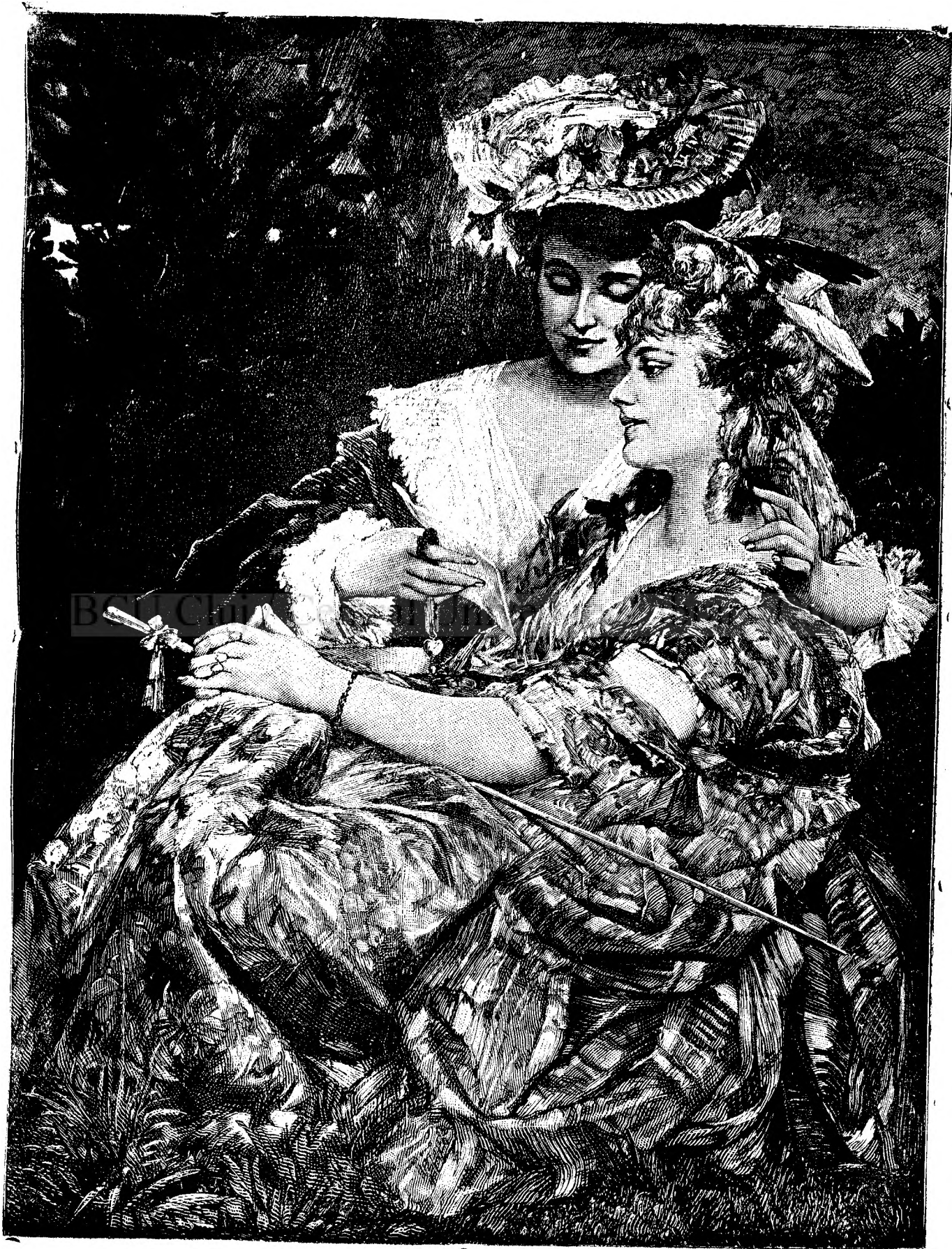
A m i c e l e . (De Hans Mackart.)