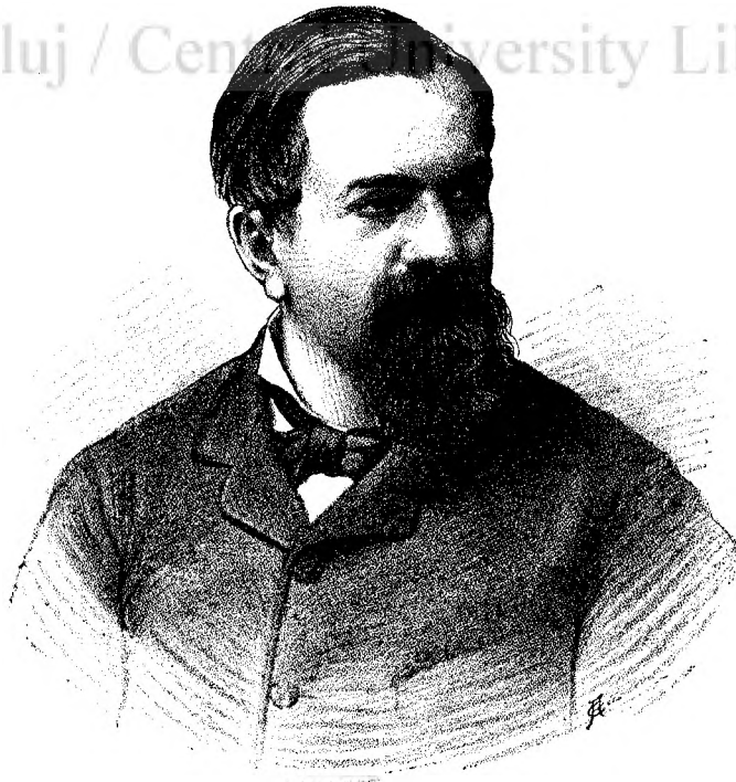
TITU MAIORESCU noul rector al universității din București.

Atunci lui Dumneđu i se umplu ochii de lacrimi și găndește 'n fnima lui, că frumósă podóbă a omului pe lume îi și inima cea bună și-i buciros c'a făcut-o