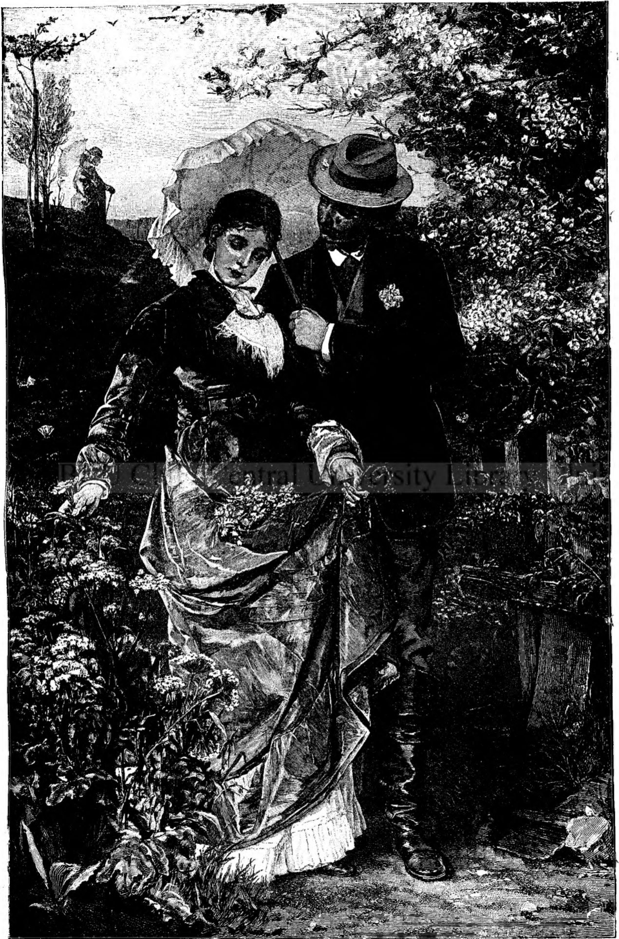
P R I M U L A M O R .