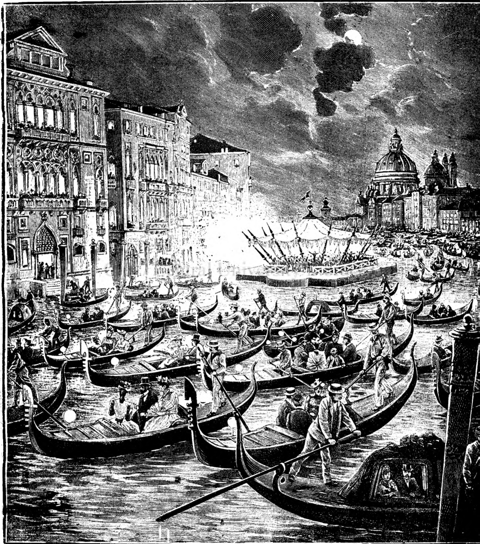
N O P T E V E N E T I A N Ă .