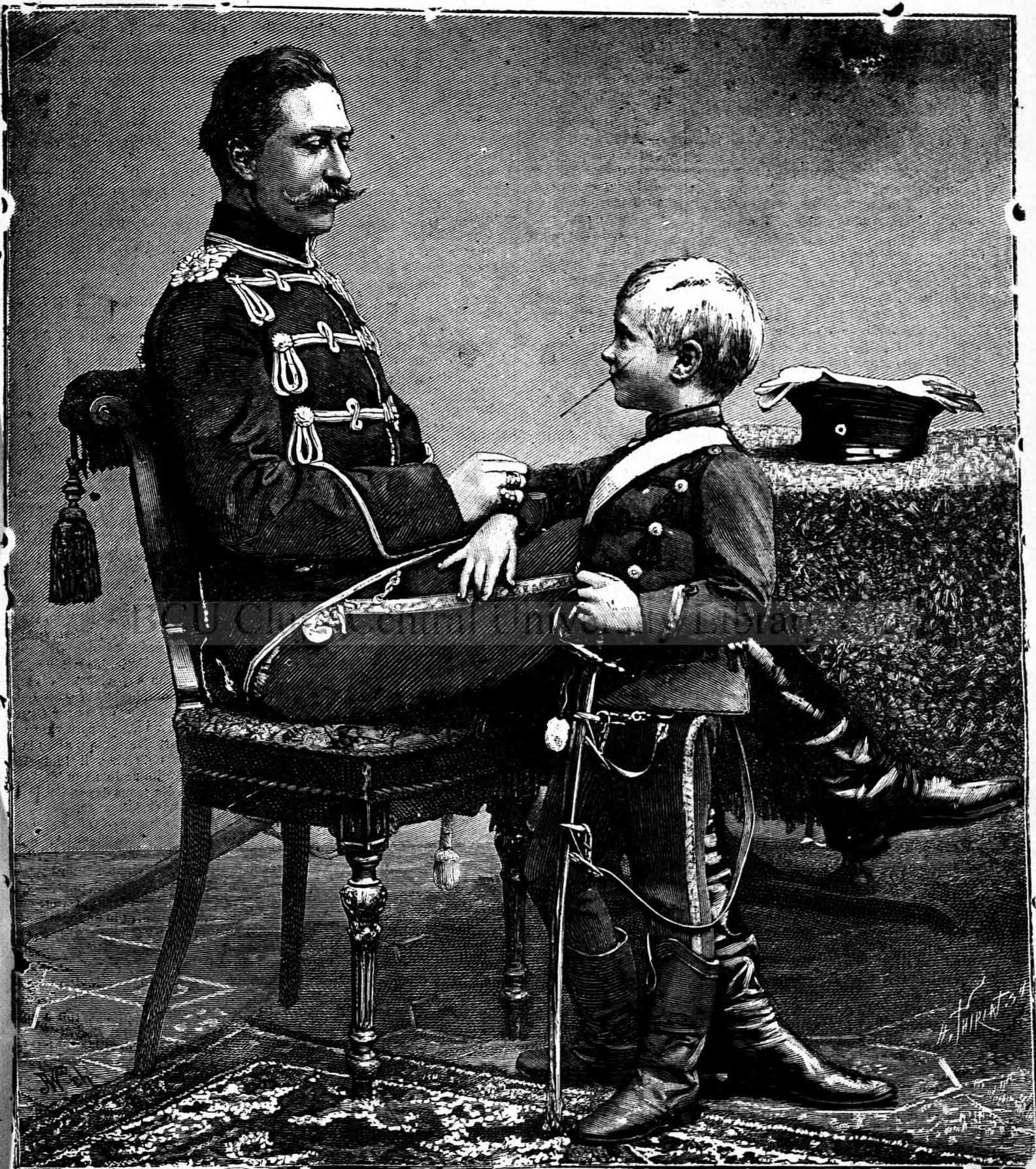
Moștenitorul de tron al Germaniei și fiul său.