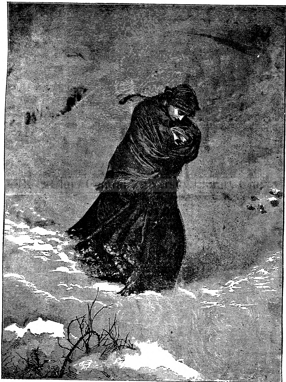
Mama și gerul