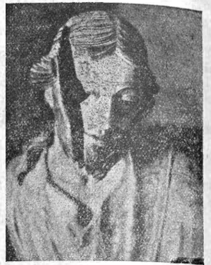
Icoană sfâșiată de bolșevici

Prăpădul dela Tătărlău. O cumplită nenorocire s'a abatut asupra frunții comune Tătărlău din județul Târnava Mică. În urma ploilor mari din săptămânile din urmă, pământul s'a înmulat mult și în zilele acestea dealul de lângă sat a început să alunece. N'a mai fost putere să oprească uriașa rostogolire de pământ. Au fost nimicite toate din cale, vile, pomii, cigoarele și sămănăturile bleșilor săteni. Pe locuri unde erau grădinile satului azi