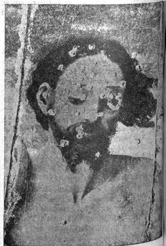
Chipul lui Hristos ciuruit de gloanțele bolșevicilor