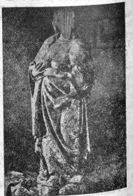
Iată până unde merge sălbăticia bolșevicilor! O statuă a Maicii Domnului ciuntită de soldații bolșevici!