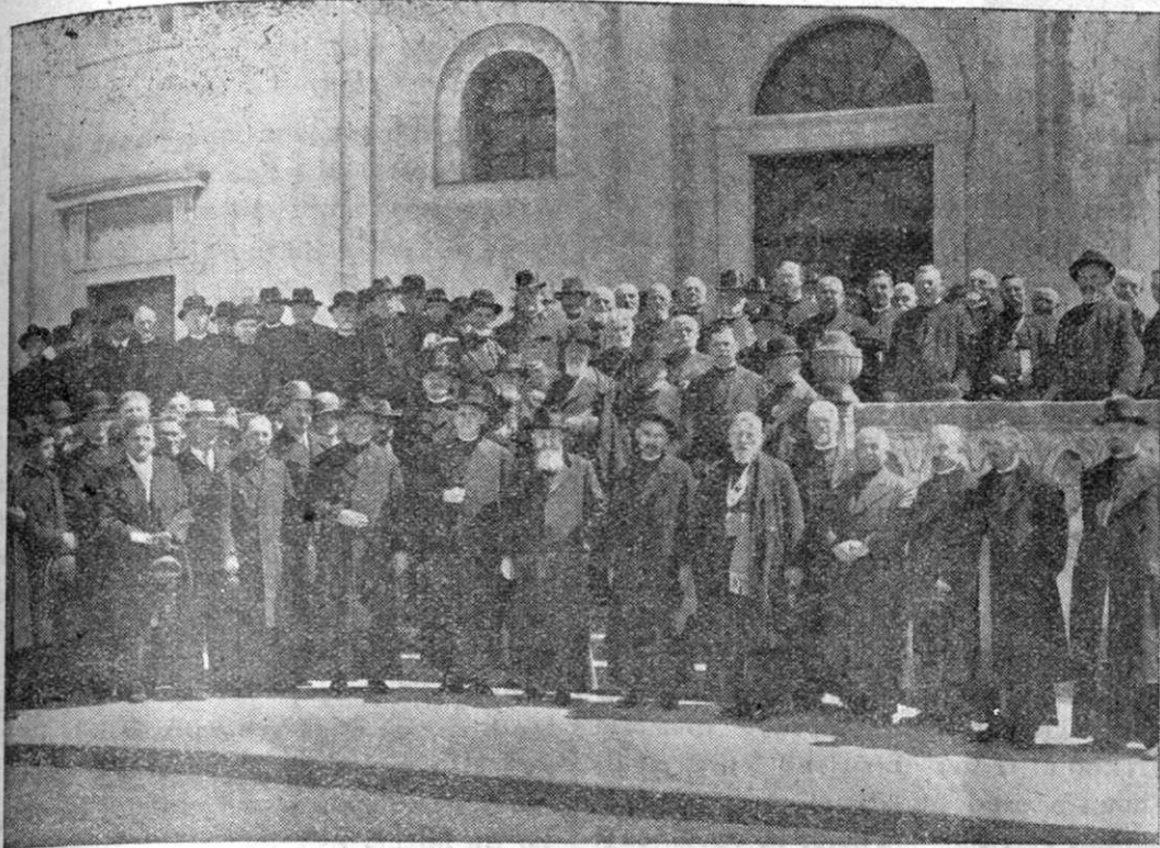
Mitropolitul Alexandru Nicolescu în mijlocul protopopilor și arhierilor după alegerea de mitropolit din anul 1935