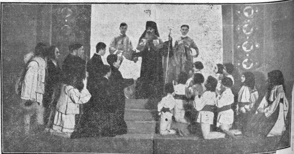
Deschiderea școlilor dela Blaj