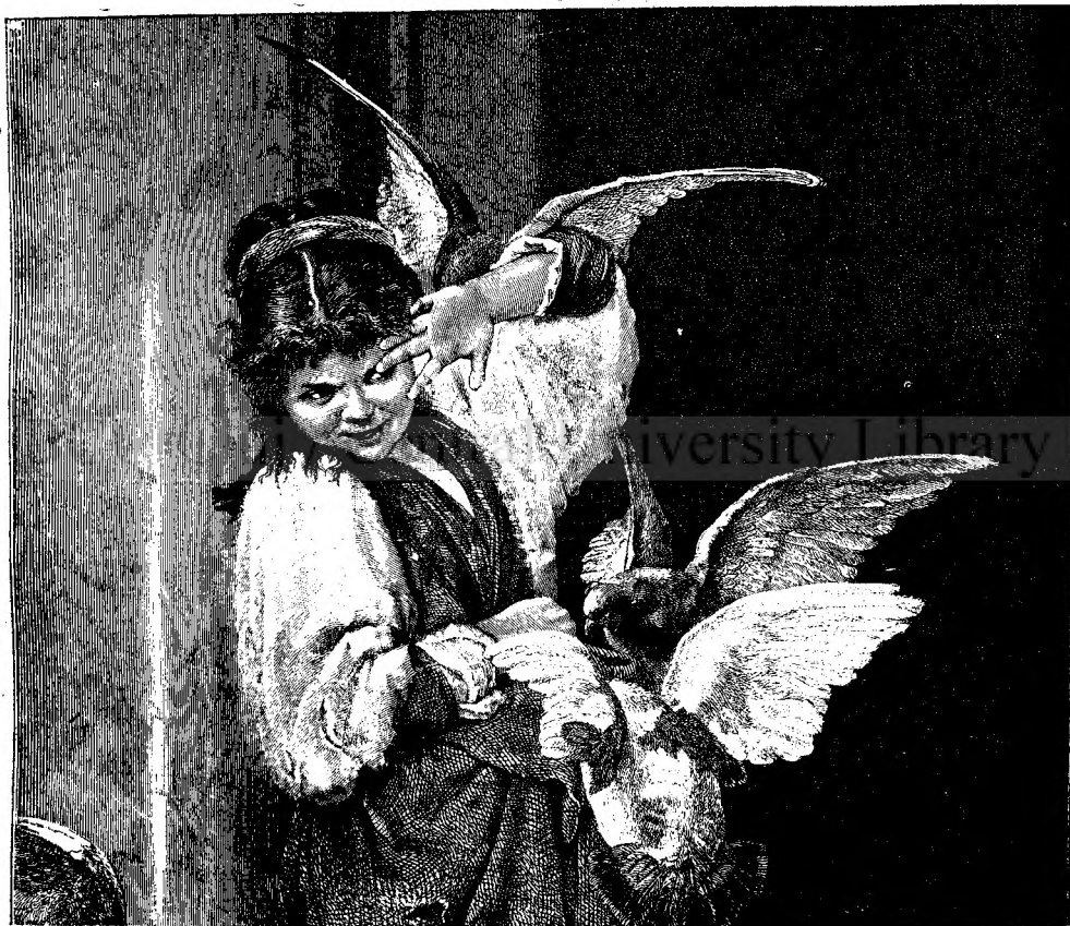
Copila și galițele.

Spins séu Érba-nebunilor și C . . . popii , numit