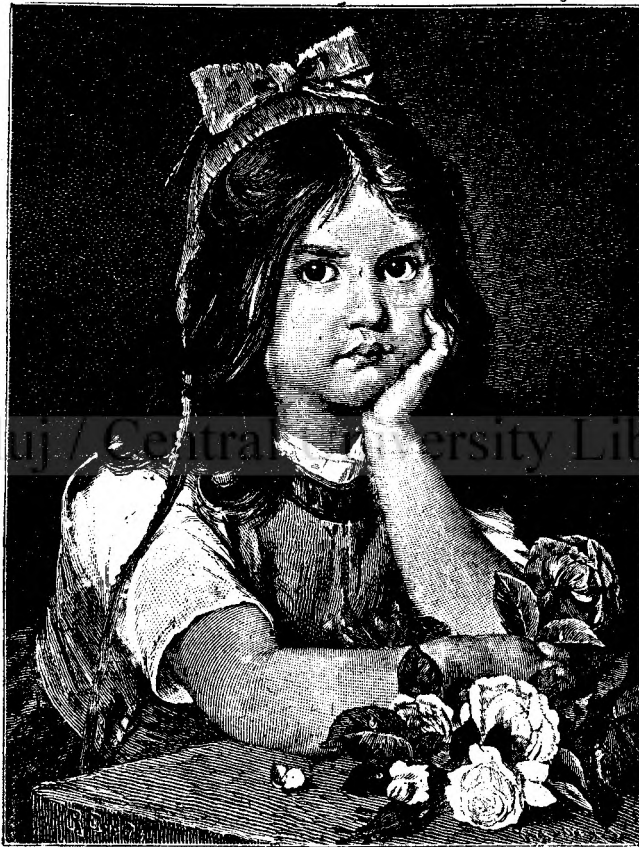
Micuța pe gânduri.

Oile, cari au gălbază séu cãlbază, după cum spun românii din ținutul Dornei, séu ori și cari alte vite gălbăgite, se vindecă cu Spinz in următorul mod: Se ie rădăcină, se uscă bine, apoi se pisază séu se rișnesce fôrte mărunțel. După acésta rădăcina pisată se amestecă cu sare și cu tărițe de săcară și așa se dă apoi vitelor in tótă săptămâna odată de mâncat, însă numai tòmna, nici odată primăvera, căci decă se dă primăvera și mai ales oilor, atunci mieii din acestea se 'nvenineză și ele trebuie să lepede. In urma acestei proceduri oile precum și celelalte vite gălbăgite trebuie